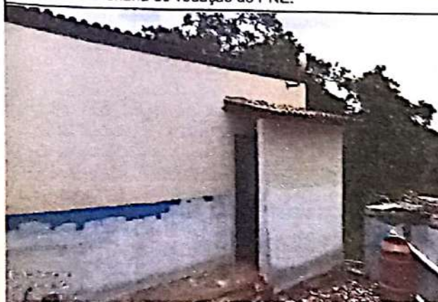
FOTO 03: Trama de madeira e telhamento com telha cerâmica do PNE.