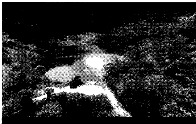
Reserva ambiental RPPN