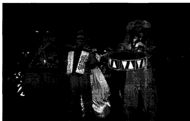
Quadrilha junina em Pernas de Pau