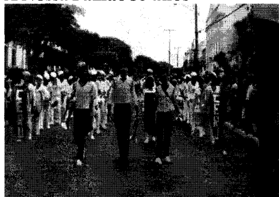
Banda do antigo CERU