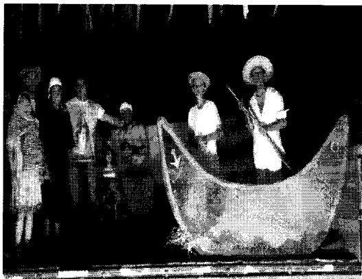
Peças religiosas com a Igreja