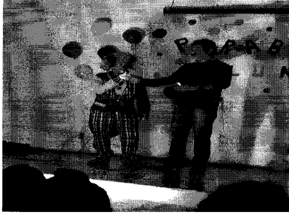
Peça, ambiental nas escolas