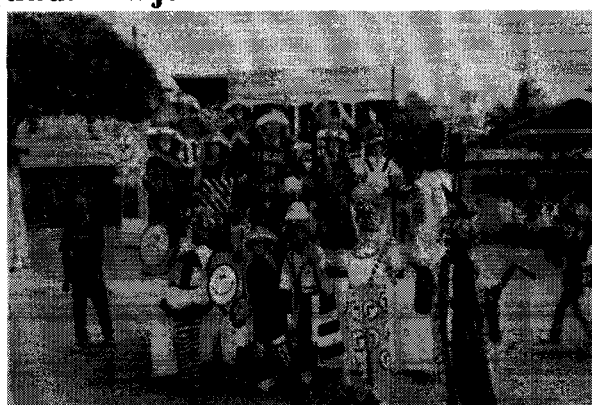
Semana do Trânsito