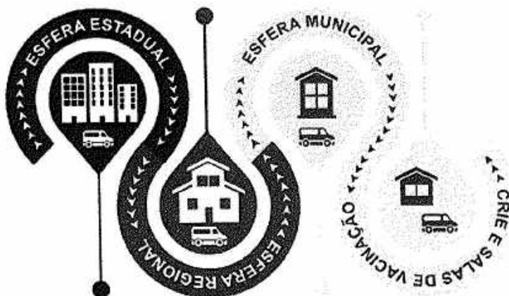
Figura 1. Desenho da rede de distribuição de imunobiológicos no estado de Pernambuco.

A investigação tem como objetivo monitorar a transmissão do vírus na ilha e fornecer evidências para orientar as ações de vigilância, sobretudo aquelas direcionadas ao apoio das retomadas das atividades sociais econômicas em segurança. Atualmente, o estudo encontra-se na quarta fase e possui de previsão de término em maio de 2021. A expectativa dos pesquisadores envolvidos é que a população esteja protegida na última fase para também favorecer a análise de efetividade e memória imunológica adquirida com o advento da vacinação.