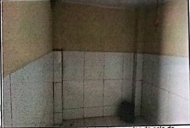
FOTO 02: Revestimento cerâmico das paredes da sala de computação.